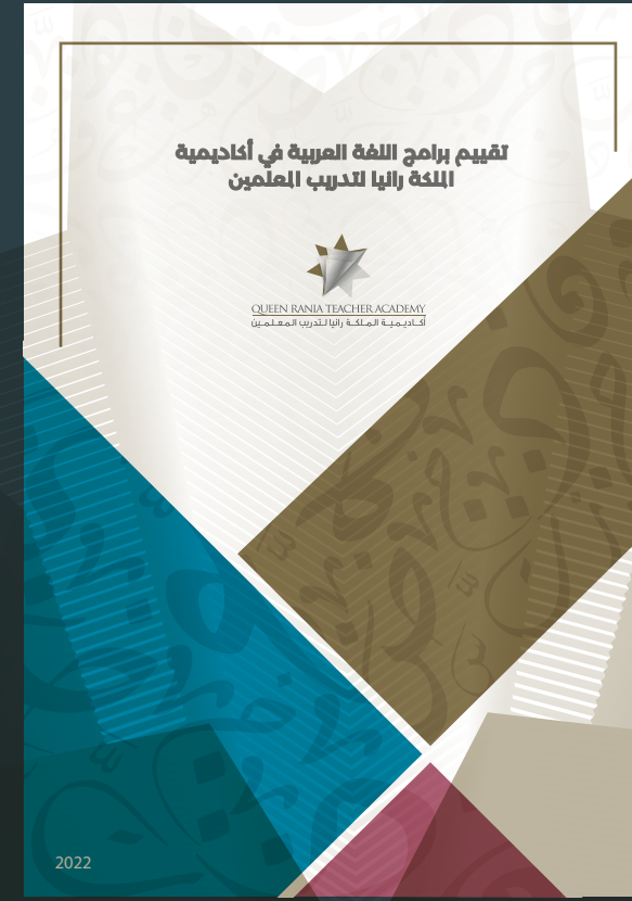
تقييم برامج اللغة العربية في أكاديمية الملكة رانيا لتدريب المعلمين