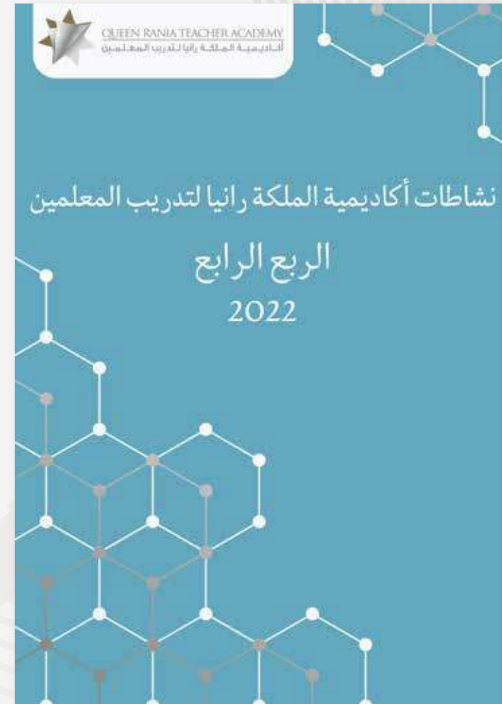
نشاطات الربع الرابع