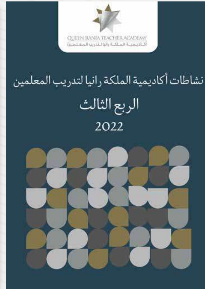
نشاطات الربع الثالث