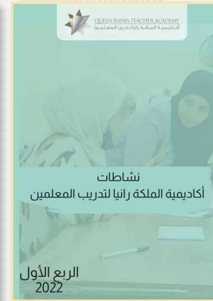
نشاطات الربع الأول