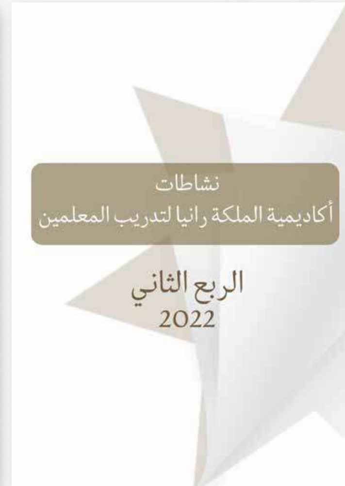
نشاطات الربع الثاني