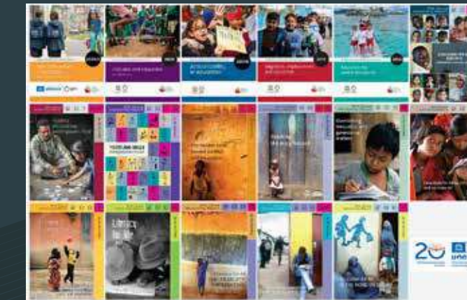
الانتهاء من تقرير الدراسة البحثية بالتعاون مع اليونيسكو لقياس مدى استخدام المعلمين للتكنولوجيا ودمجها بعنوان "صياغة وتنفيذ وتقييم الرؤى الوطنية لإعداد وتطوير المعلمين لاستخدام التكنولوجيا في الغرف الصفية".