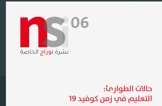
تقرير حول التحول الرقمي في برامج إعداد المعلمين: رحلة أكاديمية الملكة رانيا لتدريب المعلمين في العدد الخاص من NORRAG العدد 06. تحت عنوان "حالات الطوارئ: التعليم في زمن COVID-19".