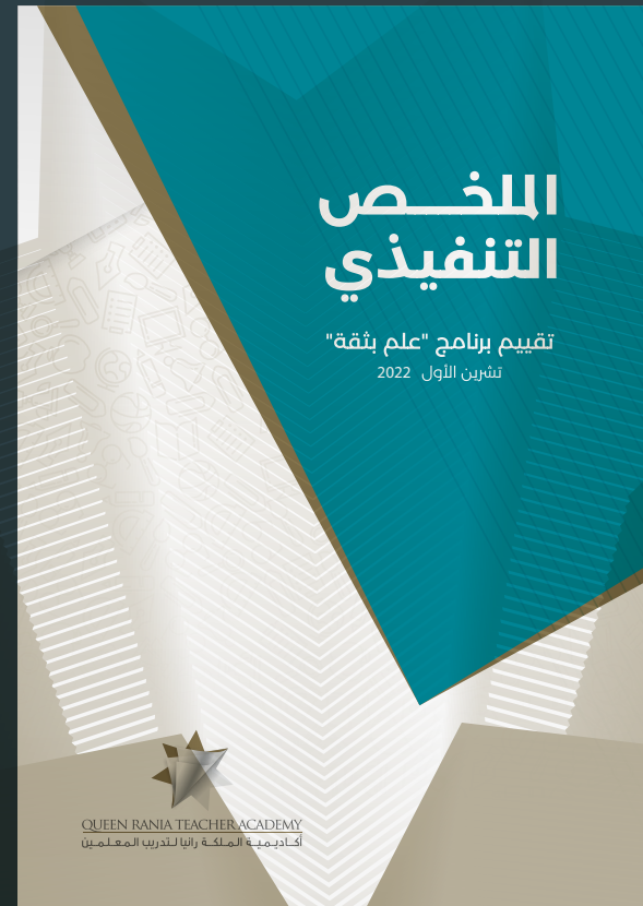
تقييم برنامج علم بثقة