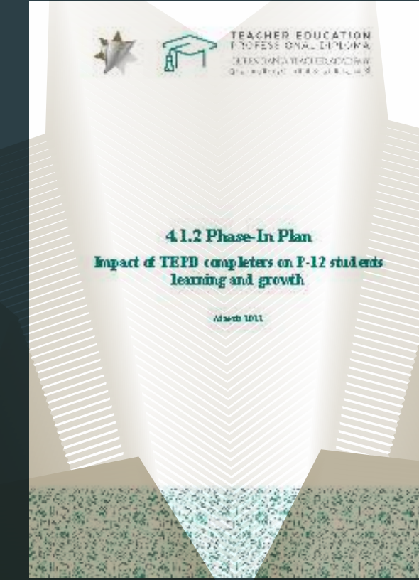
تقييم أثر المستفيدين من برنامج الدبلوم المهني في التعليم على أداء الطلبة في المرحلة الأساسية والثانوية